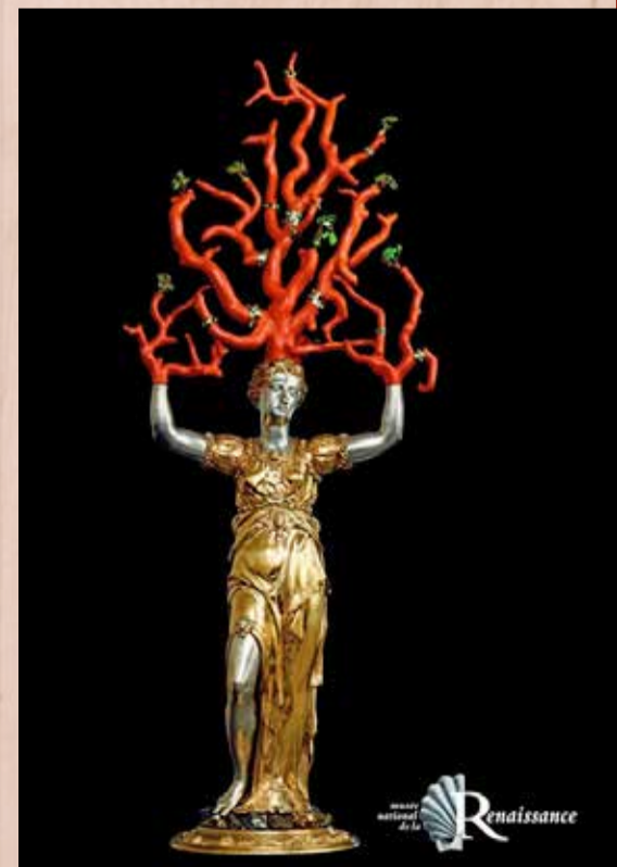
Statuette de Daphné Wenzel Jamnitzer Vers 1550, Nuremberg