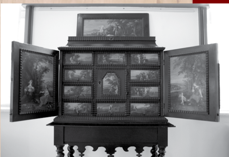
Cabinet Noyer, ébène, cuivre, étain 17 e siècle, Flandre