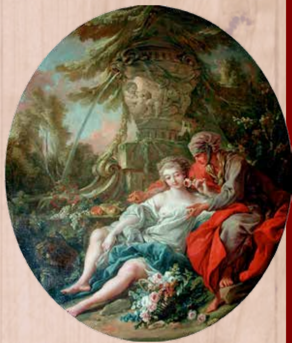
Vertumne et Pomone François Boucher 1763