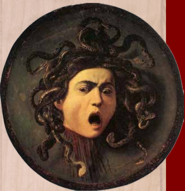
Méduse Le Caravage (1571-1610) Huile sur cuir 16 e siècle