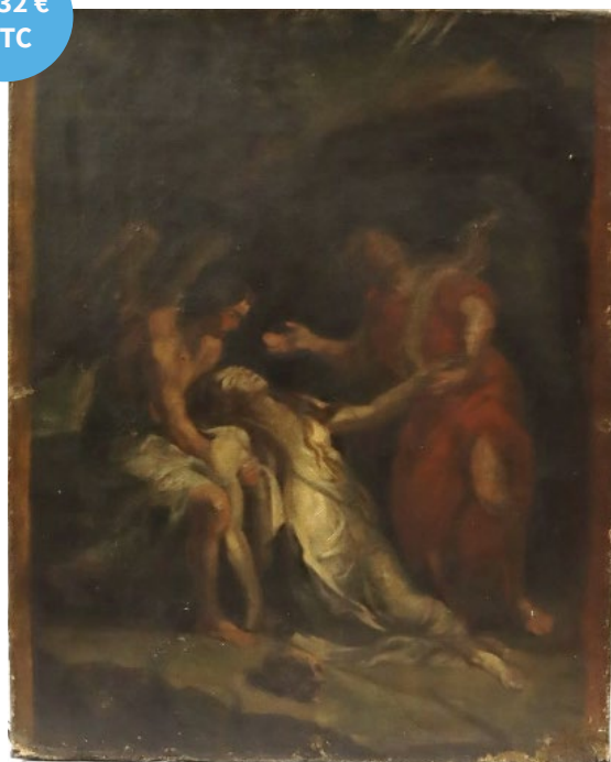
Extase de Marie-Madeleine 1 , étude, 1869-1873, d'après P.P. Rubens, huile sur toile, 41 x 33 cm