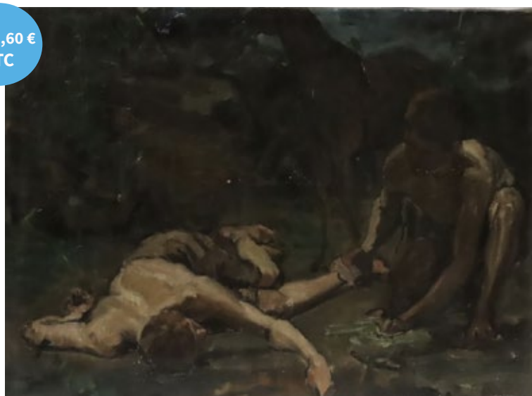
Le Bon Samaritain 2 , esquisse, 1880, huile sur toile, 27,5 x 37,8 cm