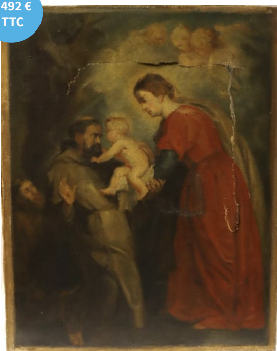
Saint-François d'Assise recevant l'Enfant Jésus 1 , étude, 1869-1873, d'après P.P. Rubens, huile sur toile, 47 x 32,5 cm