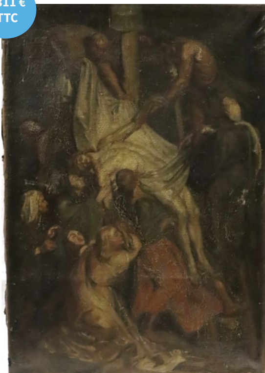
Descente de croix 1 , étude, 1869-1873, d'après P.P. Rubens, huile sur toile, 56,5 x 39 cm