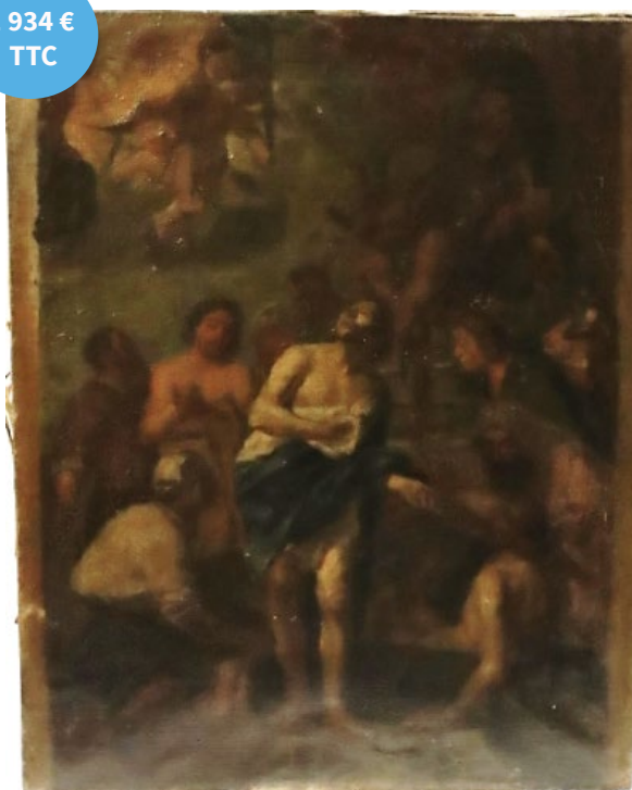
Les Martyrs enterrés vivants 1 , étude, 1869-1873, d'après Gaspard De Crayer, huile sur toile, 41,3 x 33 cm